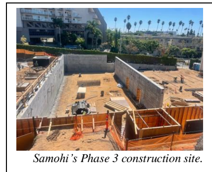
Samohi’s Phase 3 construction site.

Join Us! Parents, staff, students and community members are invited to a Santa Monica High School (Samohi) Parent Teacher Student Association (PTSA)-sponsored Campus Plan community meeting on Tuesday, Oct. 24, 2023, from 6-7:30 p.m. The meeting will be held in the Samohi Discovery Cafeteria located at 600 Olympic Blvd., Santa Monica. Parking is available in the lot off Olympic Blvd. at 6 th Street. No RSVP required.