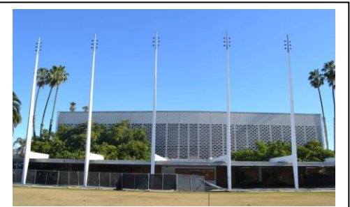
La parte exterior del Auditorio Cívico.

Aunque las conversaciones con la Ciudad de Santa Mónica se han detenido mientras la ciudad revisa otras opciones, esto le da tiempo a la comunidad de Samohi para tratar los beneficios para los estudiantes de Samohi así como los miembros de la comunidad. En la reunión se presentarán y tratarán opciones para el actual Plan para el Campus de Samohi, la incorporación del Auditorio Cívico y cómo esto modificaría el plan.